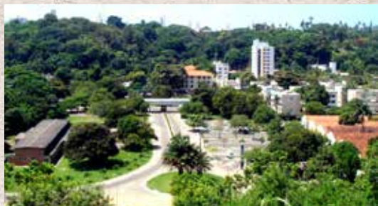
Campus Ondina / Federação

5.826.097,82 m 2 de área territorial 338.894 m 2 de área construída