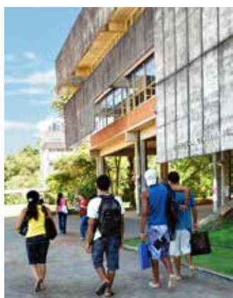
Biblioteca Universitária Reitor Macedo da Costa

Fontes: UFBA, Editora da Universidade Federal da Bahia – EDUFBA, (1) EDUFBA e outras editoras Repositório Institucional (RI) https://repositorio.ufba.br/ri/