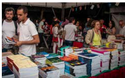
Festival de Livros e Autores da UFBA